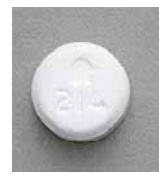
フリバス OD (排尿障害治療薬)