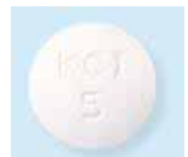
マグミット (緩下剤)