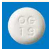
プレタール OD (抗血栓薬)