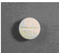
ノルバスク OD (降圧薬)