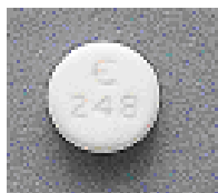
アリセプト D (アルツハイマー型 認知症治療薬)